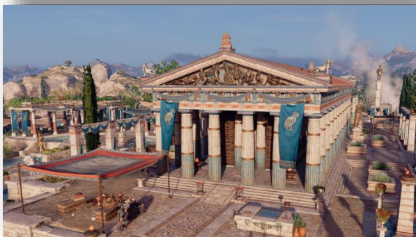
Temple d'Héphaïstos à Athènes. Image tirée du jeu Assassin's Creed Odyssey (2019).

Grâce à leur définition, retrouve les mots formés à partir des prépositions/préfixes grecs suivants.