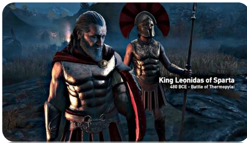
Roi Léonidas de Sparte. Image tirée du jeu Assassin's Creed Odyssey (2019).