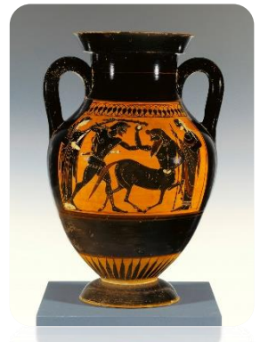
Héraklès attaquant un centaure, Athènes, Grèce, 530-530 av J.-C.